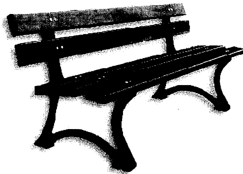
Rys. przykładowa ławka.